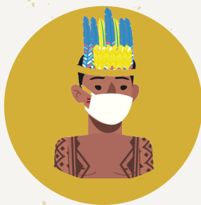
USO DE MASCARILLAS

Por lo tanto, se debe mantener las medidas de prevención frente a la enfermedad: