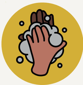
LAVADO CONSTANTE DE MANOS